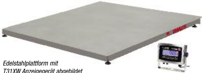
Edelstahlplattform mit T31XW Anzeigergerät abgebildet