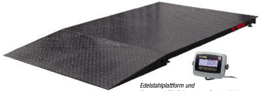
Edelstahlplattform und Rampe mit T31P Anzeigergerät abgebildet