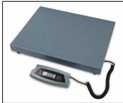
Modelle mit 75 kg und 200 kg sind wahlweise mit großer Plattform verfügbar